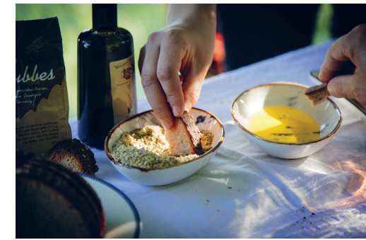
Kulinarik und Genuss