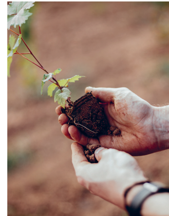
Weingeschichte und Zukunft