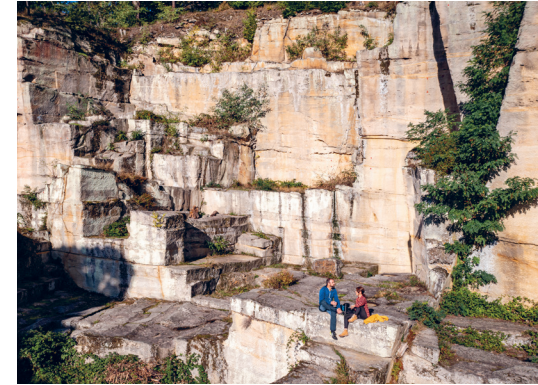
Natur- und Landschaftsführungen